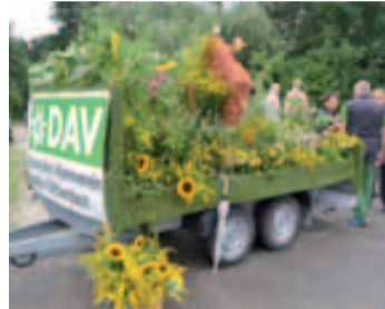
Blumenwiese des DAV