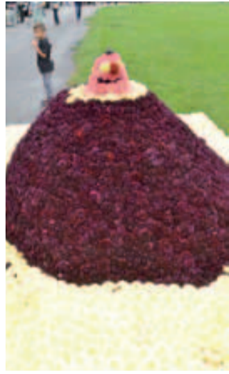
Schubberer mit dem Maulwurf