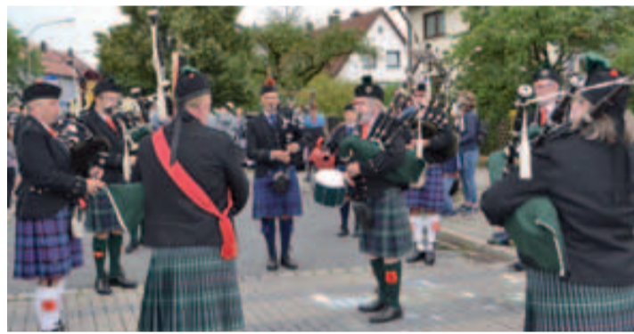
Die Dudelsackspieler waren die Verantwortlichen für den sehr langen Abriss des Zuges, stellten sie sich doch zum Spielen meist hin und hielten so die hinteren Wagen auf, während die vorderen natürlich weiterfuhrten.

Unerwartete Prominenz fand sich unter den vielen Besucherinnen und Besuchern mit Schauspieler und Sänger Tom Beck, geboren und aufgewachsen in Brunn, und bekannt aus „Alarm für Cobra 11“, und seiner Frau Chryssanthi Kavazi, bekannt aus der Serie „Gute Zeiten, Schlechte Zeiten“ und dem Format „Let’s Dance“.