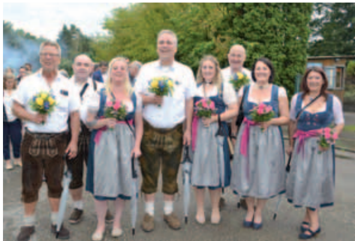
Die Vorstandschaft des Vereinskartells zu Beginn des Zuges am Alten Festplatz im Pegnitzgrund