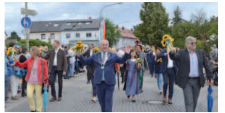
Die Marschgruppe der Bürgermeister mit Stadträten und Ehrengästen. Unten links der Pinocchio der Kolpingsfamilie, dessen Nase wuchs und wuchs. und rechts das Hexenhaus der Schützengesellschaft.