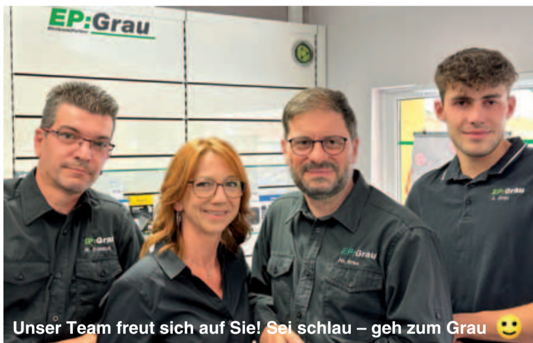
Unser Team freut sich auf Sie! Sei schlau – geh zum Grau 😊