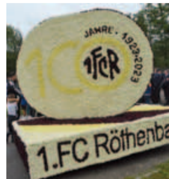
100 Jahre 1. FC Röthenbach