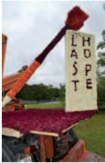
Dart Club Last Hope mit Dartpfeil