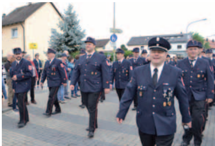
Da hatten sie noch gut lachen, die Kameraden der FFW Röthenbach, die nach dem Regen patschnass am Ziel ankamen.