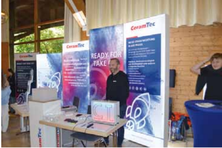
Hoch im Kurs standen an allen Ständen natürlich die Beratungsgespräche, ob bei CeramTec aus Lauf oder wie hier