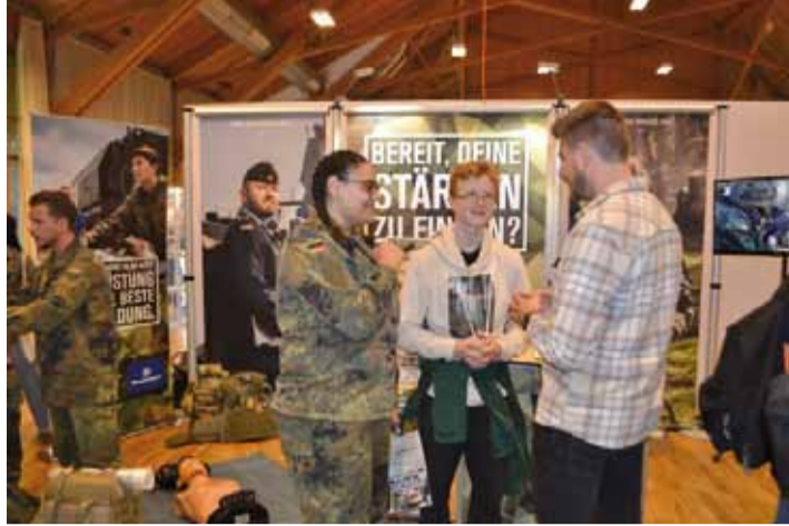
bei der Bundeswehr, wo auch eine Wehrpflichtige den Jungs und Mädchen Rede und Antwort stand.

Insgesamt wurden auf der Berufsmesse über 2.000 Ausbildungsplätze aus den verschiedensten Branchen angeboten. Die meisten Schulen des Landkreises besuchten im Rahmen ihres Unterrichts die Berufsmesse. Sie nutzten an den beiden Tagen die Möglichkeit, sich an den Ständen und bei Vorträgen der