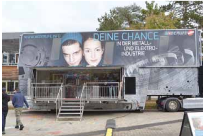
Handwerksberufe der Info-Truck der Metall- und Elektroarbeitgeber am Schulhof der Geschwister-Scholl-Mittelschule