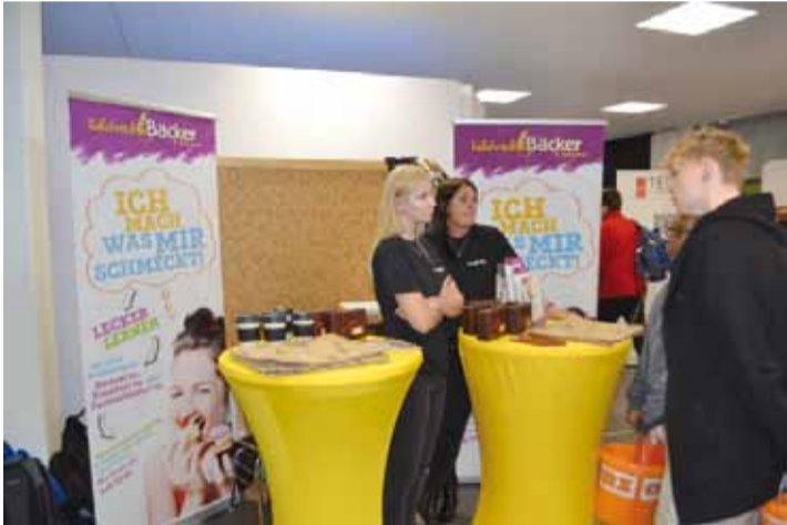
Für jeden und jede war was dabei: unter den 65 Unternehmen auch der Kalchreuther Bäcker und stellvertretend für viele