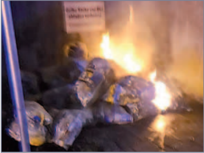
Einsatz Nr. 01/2024 - 01.01.2024 00:11 Uhr Brand am Gebäude Grünthalstr., Röthenbach Bild oben Fahrzeuge: MTW, LF 16/12, DLK 23/12, TLF 4000, GW Logistik Dauer: 1,0 h