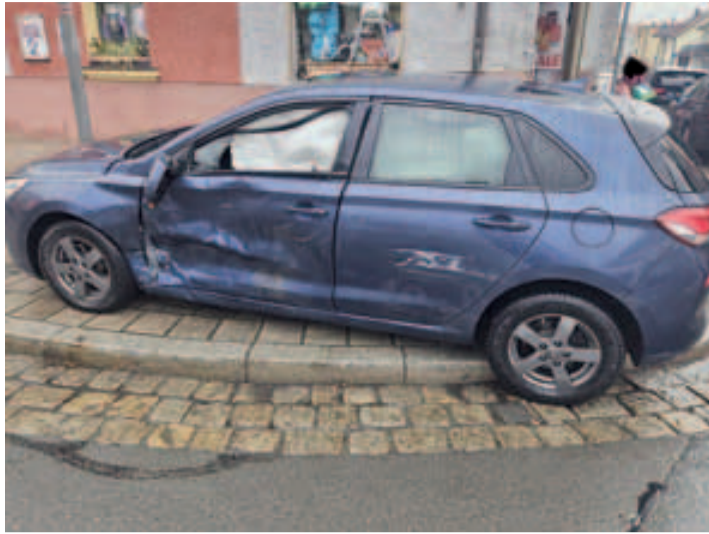
Einsatz Nr. 11/2024 - 01.02.2024 9:58 Uhr VU mit PKW Rückersdorfer Straße, Röthenbach Bild oben Fahrzeuge: MTW, LF 16/12, RW, GW L 1 Dauer: 0,75 h