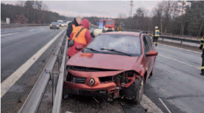
Einsatz Nr. 06/2024 - 14.01.2024 16:29 Uhr Bild oben Verkehrsunfall PKW BAB A9 -> München Fahrzeuge: MTW, LF 16/12, GW-L1, RW, LF 20 KatS mit VSA Dauer: 1,0 h