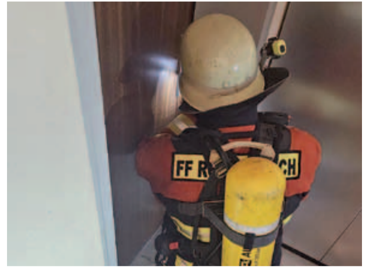
Einsatz Nr. 13/2024 - 03.02.2024 17:00 Uhr Ölspur Ortsgebiet, Röthenbach Fahrzeuge: MTW, GW L1, RW Dauer: 2,5 h